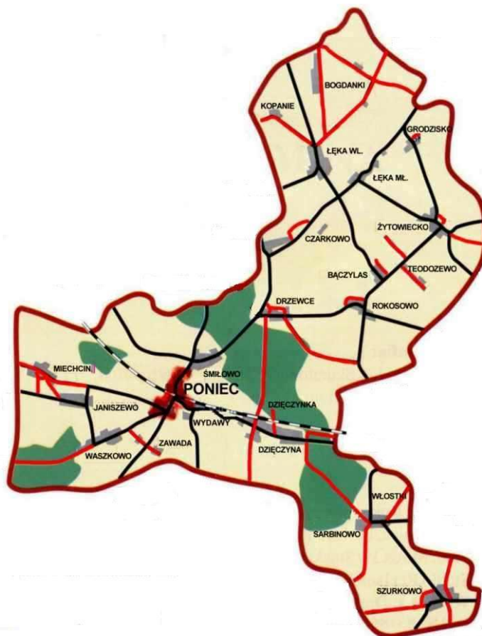
Rysunek 1. Mapa Gminy Poniec

Gmina Poniec zajmuje powierzchnię 131,9 km 2 , co stanowi 16,33% powierzchni powiatu gostyńskiego. Miasto i Gmina Poniec administracyjnie dzieli się na miasto Poniec i 19 wsi sołeckich: Bogdanki, Bączylas, Czarkowo, Drzewce, Dzieczęzna, Grodzisko, Janiszewo, Łęka Mała, Łęka Wielka, Miechcin, Rokosowo, Sarbinowo, Szurkowo, Śmiłowo, Teodozewe, Waszkowo, Wydawy, Zawada i Żytowiecko.