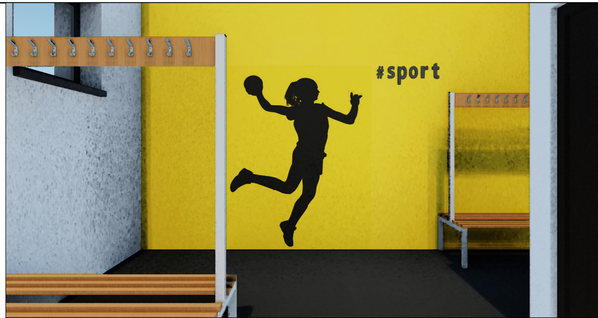
widok 3d podglądowy